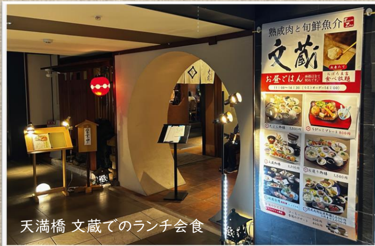
天満橋 文蔵でのランチ会食