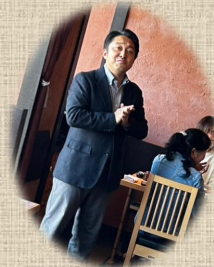
川村会長のあいさつ