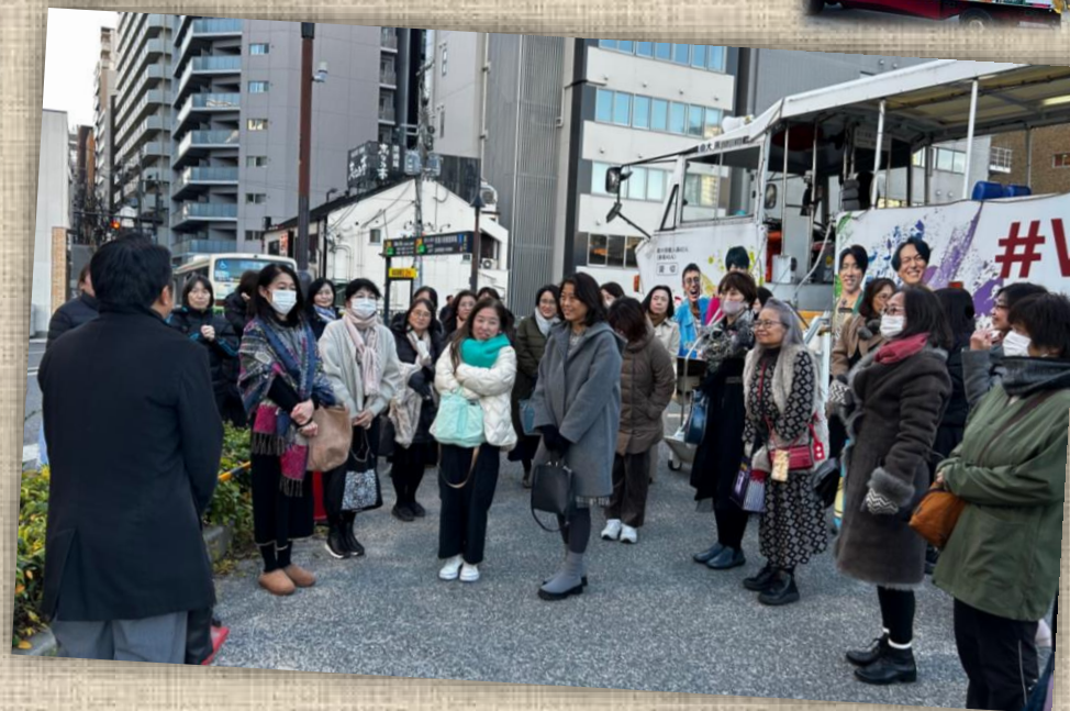
たくさんのご参加ありがとうございました(〜)