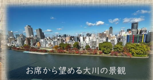
お席から望める大川の景観