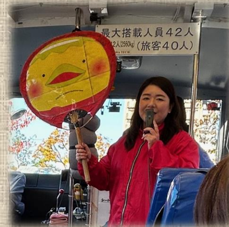
ガイドさんの面白トークで、大満足のダックツアー