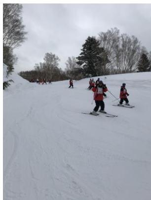
スキー実習の様子