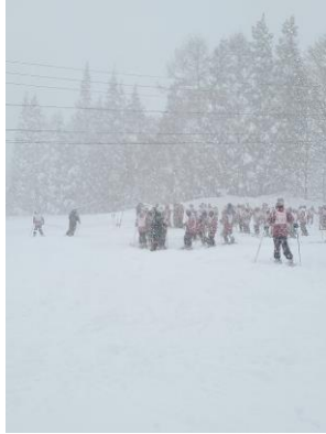
スキー実習の様子①