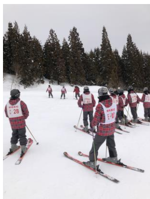
スキー実習の様子