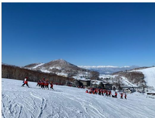
スキー実習の様子