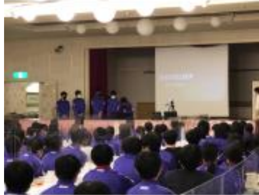
研究発表本選の様子