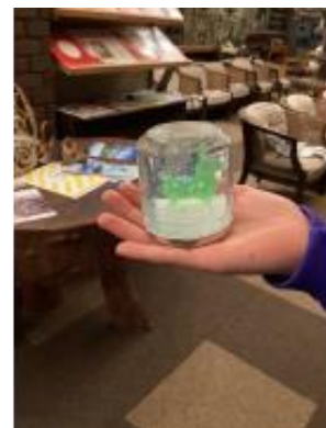
スノードーム作り