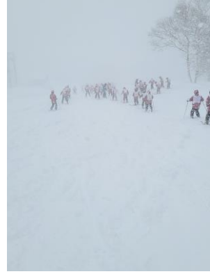
スキー実習の様子②

高校1年生はスキー実習の夜の時間(2日目、3日目)を利用して、研究発表の本選を行います。学校で実施したクラス予選を勝ち抜いた代表1グループが発表します。講評では、秋の校外学習でもお世話になった京都大学の学生からオンラインで参加していただきました。