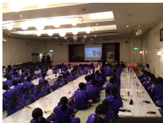
研究発表本選の様子

3日目の研究発表本選の様子です。昨日は京大生から効果的なプレゼンの仕方についてレクチャーもいただくことができました。