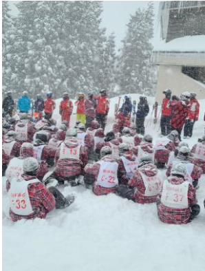
開校式の生徒代表宣言 (F組N君)

今日からスキー実習が始まります。本日は朝から空は曇っていて、雪模様の実習となりました。午後実施した開校式では、生徒代表がお世話になる赤倉銀嶺スキー学校のインストラクターの先生に決意表明をしました。感謝の気持ちを持って、残り4日間成長してくれることを期待しています。