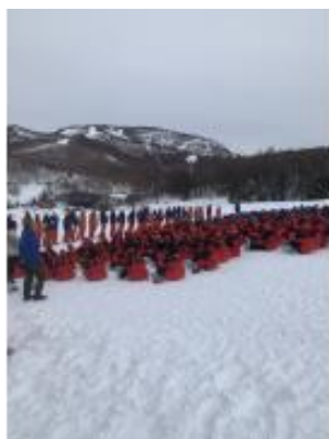
スキー実習の様子