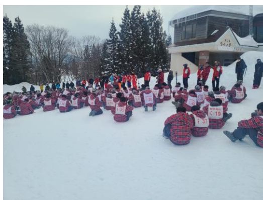
閉校式(生徒代表C組Y君)