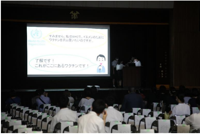
研究発表 (体育館2階)