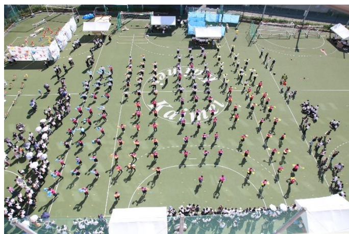
OP ダンス①（人工芝グラウンド）