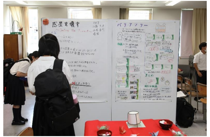
研究発表 (高1クラス)