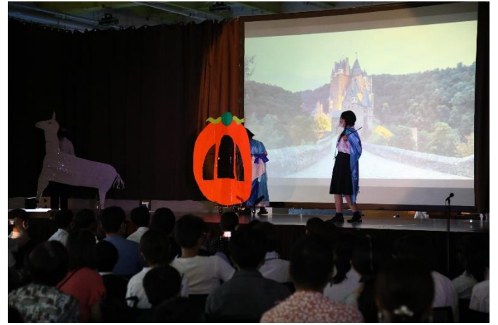
舞台発表 (8階屋内運動場)