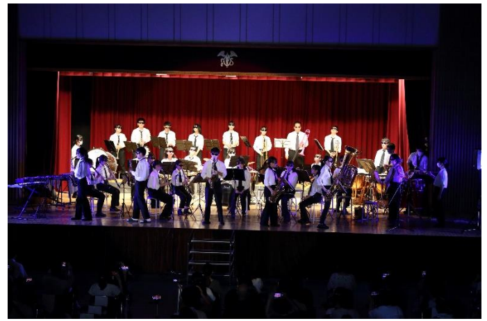
クラシック音楽部