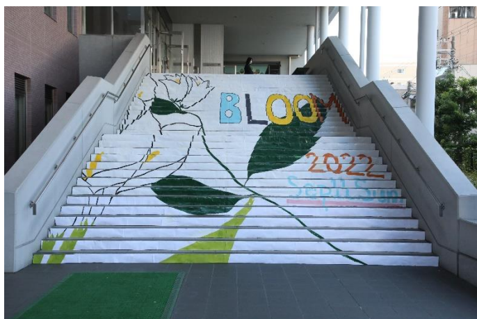
文化祭のテーマ“bloom”（大階段）