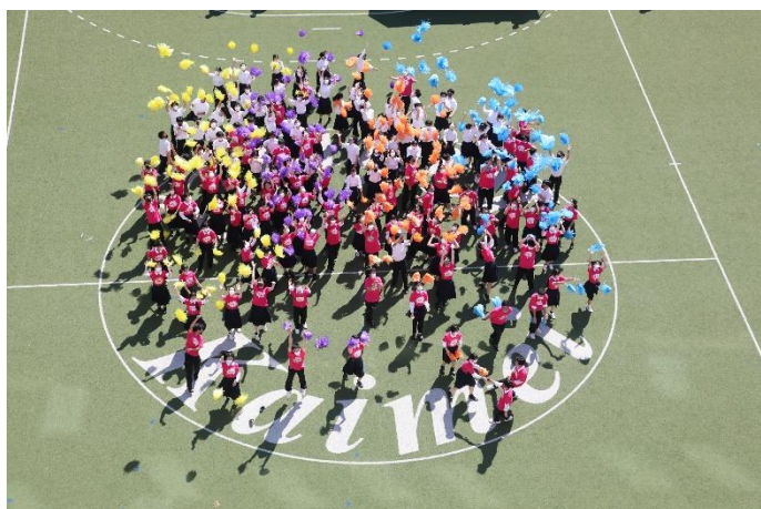
OP ダンス②（人工芝グラウンド）